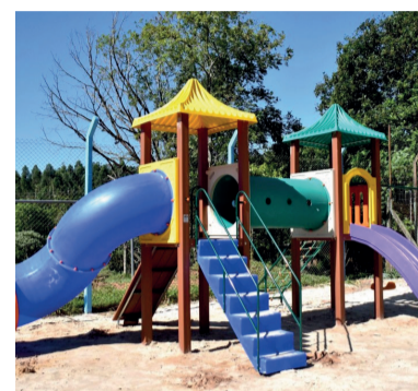
EMEF Guilhermina Mertins