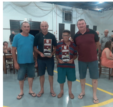
Campeonato Municipal de Schoffkop