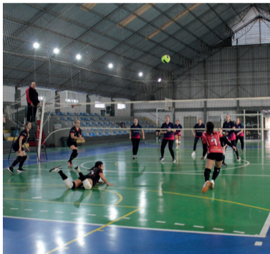
Campeonato Intermunicipal de Vôlei