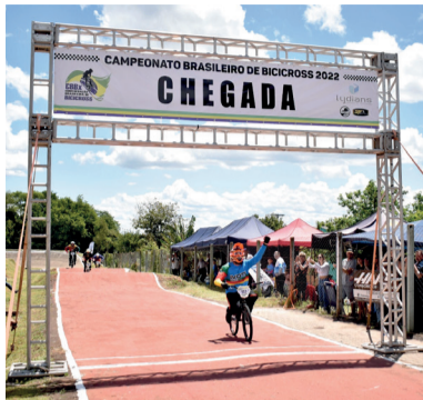
Campeonato Brasileiro de Bicicross