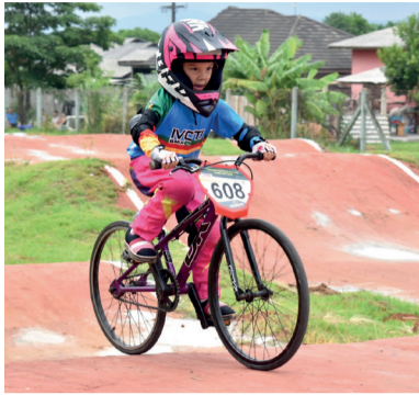
Copa Verão de Bicicross