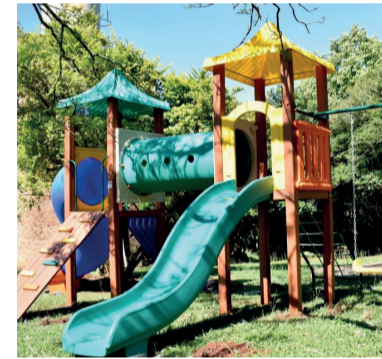
EMEF Nicolau Fridolino Kunrath