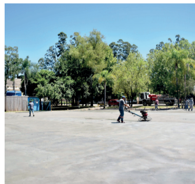
Piso de concreto polido no Núcleo. R$150 mil, com recursos próprios