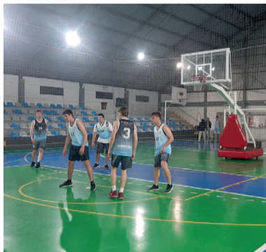
Torneio Municipal de Basquete