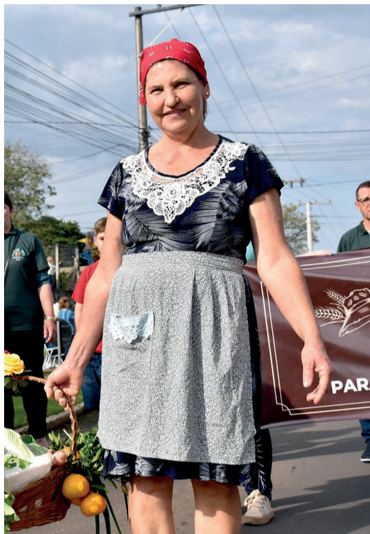
Depois de dois anos, o desfile voltou, reunindo grande público em ruas da cidade.