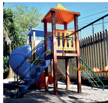
EMEF 19 de Outubro