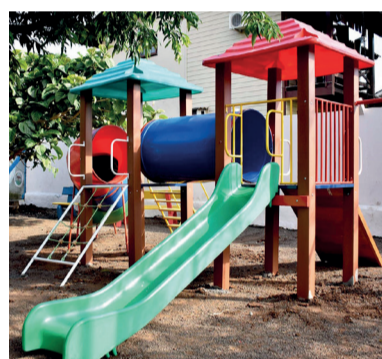
EMEF Jardim Panorâmico