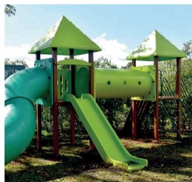
Ceami (Centro de Educação Ambiental)