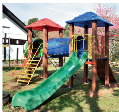
Memorial da Colônia Japonesa