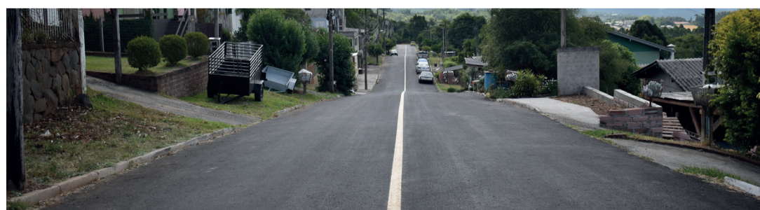
Rua Dois Irmãos