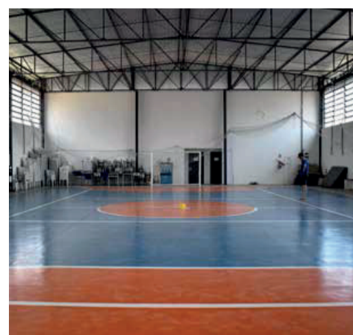
Pintura na quadra de esportes da EMEF Aroni Mossmann