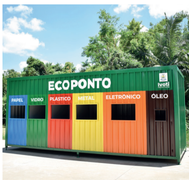
Instalação de dois Ecopontos