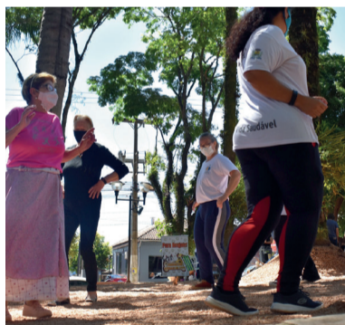
Municipalização do Projeto Vida Saudável