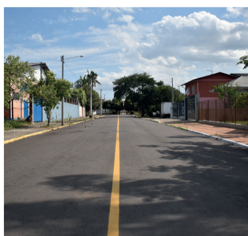
Rua Flores da Cunha