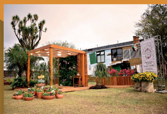
Flores no Cais