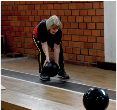
Campeonato Estadual Melhor Idade Feminino de Bolão - Bola 23