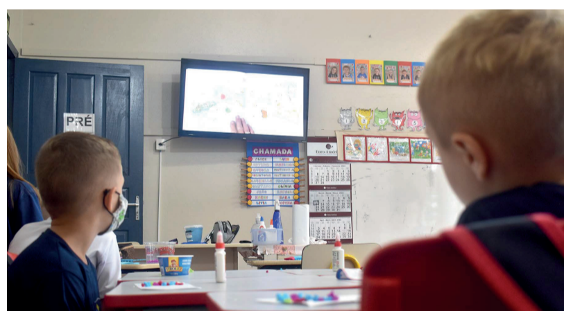
TVs e wi-fi