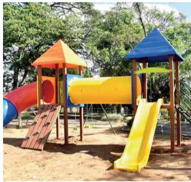
Praça Neldo Holler Burle Marx