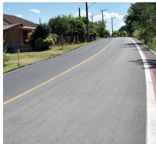
Estrada Picada 48 Baixa