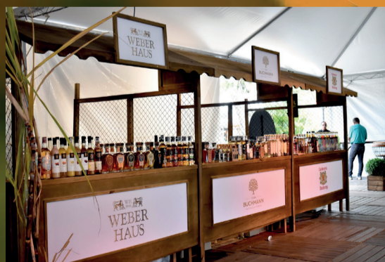
Alambique no Cais

Ivoti presente em dois eventos no Cais Embarcadero, em Porto Alegre.