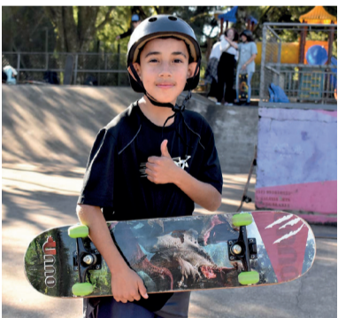
kits de skate para oficina do Plug