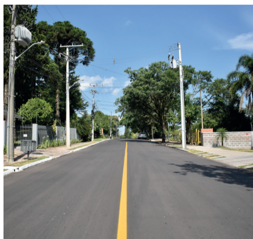
Rua Thomas Edison