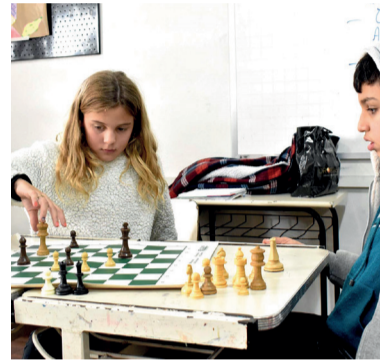
Festival de Xadrez Escolar