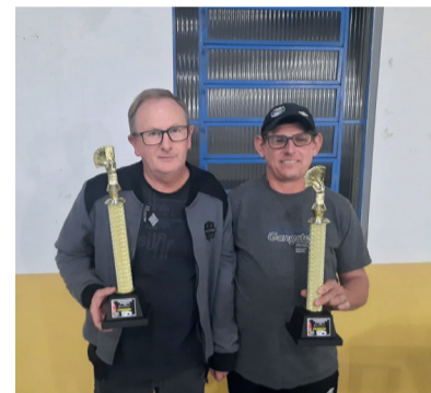
Campeonato Municipal de Canastra