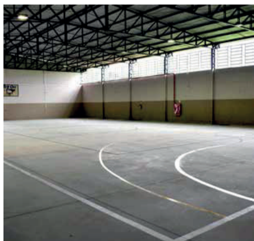
Reforma na quadra de esportes da EMEF Nelda Julieta Schneck