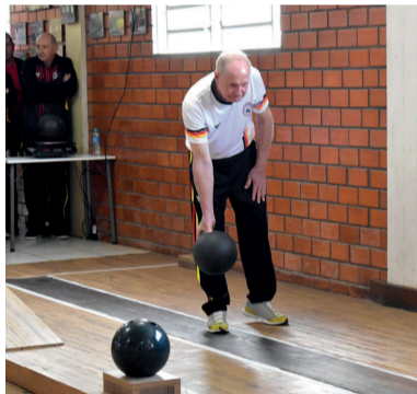
Campeonato Estadual de Bolão - Bola 23: Melhor Idade Masculino