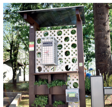
Instalação de quatro chimarródromos

Locais: Praça Concórdia, Praça Emancipação, área de lazer do bairro Bom Jardim e Praça Ecológica.