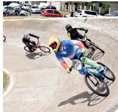
Campeonato Gaúcho de BMX