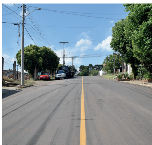
Rua Rio de Janeiro