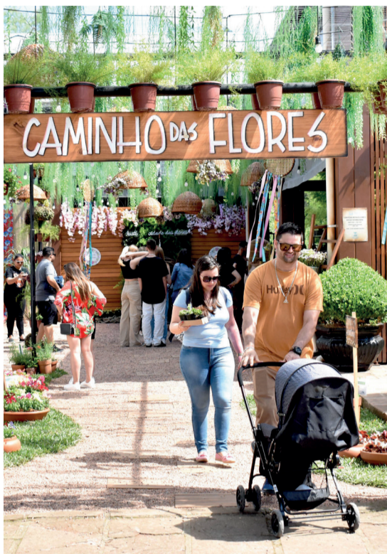
Novidade: gastronomia à base de flores!