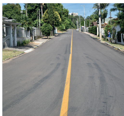
Rua Albino Hugo Muller