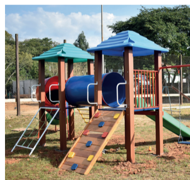
Área de Lazer do Bairro Bom Pastor