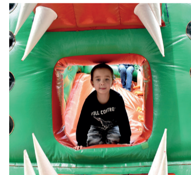
Evento Ruas de Lazer