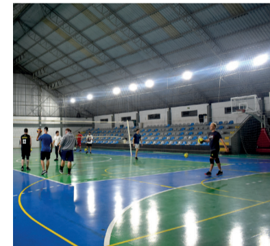
Renovação da iluminação do Ginásio Municipal 20 de Setembro