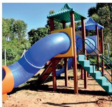
Área de Lazer do Bairro União

Investimento de R$ 140.150,00, com recursos próprios